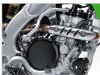
Flüssigkeitsgekühlter 249 cm³-Viertakt-Einzyylinder